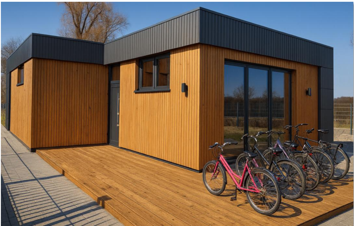
Ilyen, tisztálkodást biztosító mobilházak létesülnek