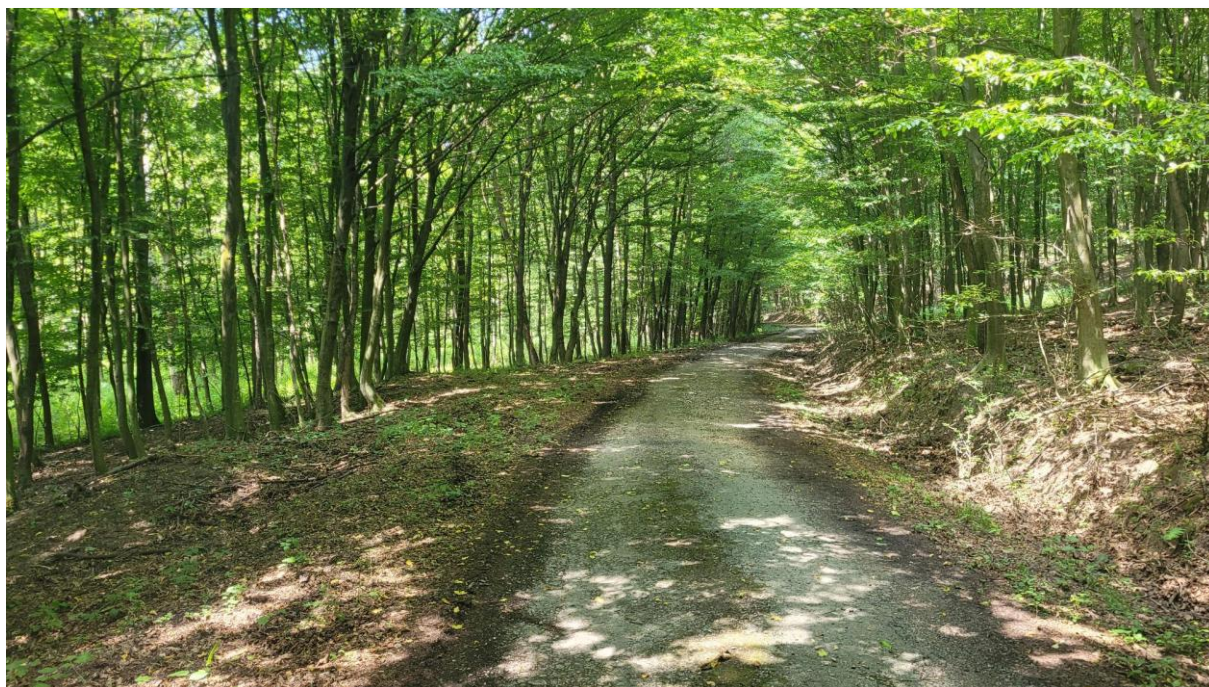
A kijelölésre, rendbetételre váró erdei utak egyike

A projektet egy konzorcium valósítja meg 440 millió forint összegű vissza nem térítendő európai uniós támogatásból. A konzorcium 9 aktív partnere: Komárom-Esztergom Vármegye Önkormányzata (konzorciumvezető), Komárom-Esztergom Megyei Területfejlesztési Kft., Duna-Gerecse Turisztikai Nonprofit Kft., Ácsteszer Község Önkormányzata, Bakonybánk Község Önkormányzata, Csatka Község Önkormányzata, Kisbér Város Önkormányzata, Súr Község Önkormányzata, Réde Község Önkormányzata.